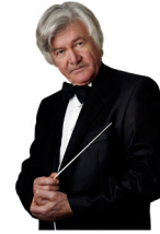
Гоноболін Олександр Чарльзович

Почесний громадянин міста Херсон, Народний артист України, член Союзу композиторів України, диригент, скрипаль