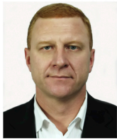
Грабар Юрій Григорович

Почесний громадянин міста Херсон, Народний артист України, член Союзу композиторів України, диригент, скрипаль